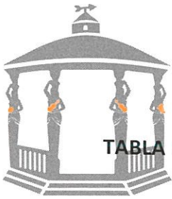
TABLA ESTADÍSTICA DE LA CUARTA SESIÓN DEL PRESENTE AÑO DE LA COMISIÓN EDILICIA DE ESPECTÁCULOS.